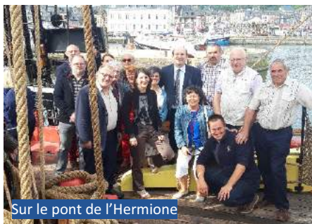
Sur le pont de l'Hermione

► Permettre la diffusion de leurs disponibilités grâce à la liste remise aux familles.