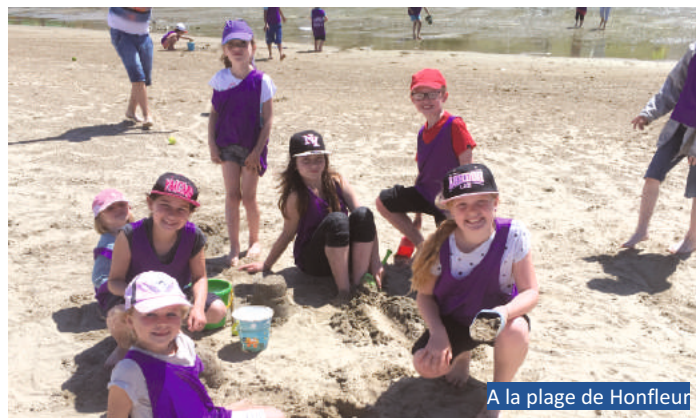
A la plage de Honfleur

Les frais d'entrée pour les sorties ne sont pas inclus mais pris en charge par les familles dans la limite de 5 € Goûters non fournis