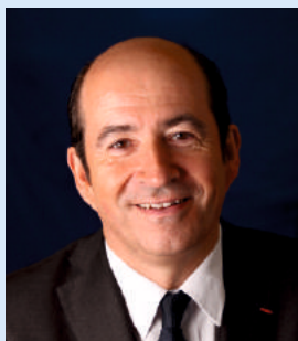
Michel LAMARRE Président de la Communauté de Communes du Pays de Honfleur-Beuzeville