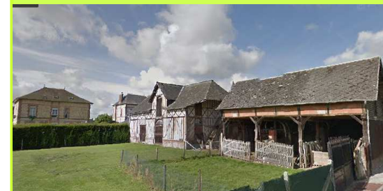
Ensembles traditionnels rue au Coq