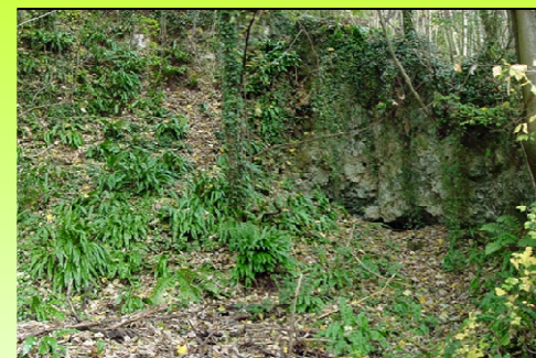
Un ensemble exceptionnel en Haute-Normandie