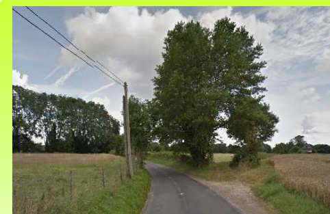
Coupure verte structurante entre la Hannetot et la Champagne