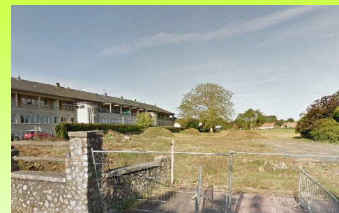
Équipement scolaire et secteur de la Bertinière en arrière plan