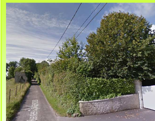
Ambiance champêtre véhiculée par les haies domestiques d'essences locales rue des Coutances