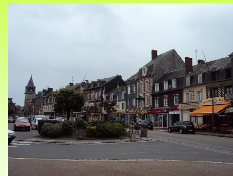
Axe commerçant (RD 313)

BEUZEVILLE bénéficie d'une offre de commerces répartis essentiellement le long de la RD 675, jouissant de la vitrine offerte par cet axe de communication majeur.